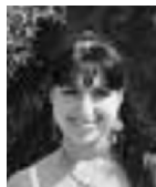
Материал подготовила Екатерина Эрязова

В подарок стоит преподнести золотые ювелирные украшения, а также украшения с камнями красного, желтого, оранжевого цветов. (Если ваши родители выделяют вам денег на такие презенты ☺).